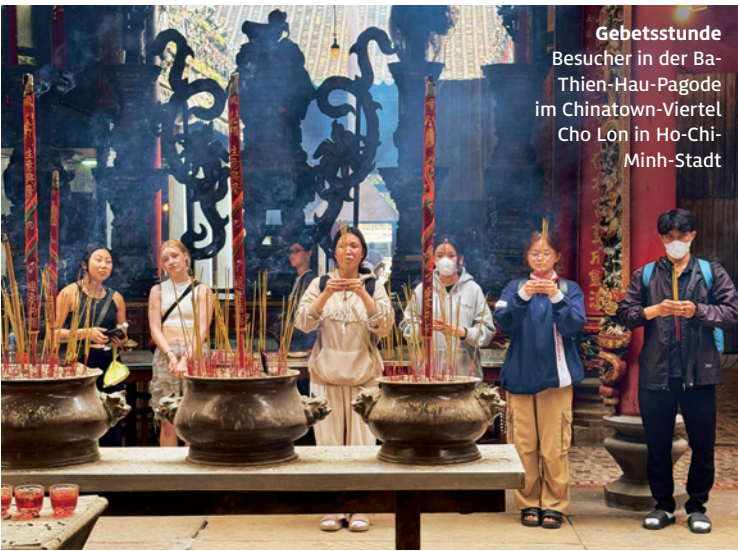
Gebetsstunde Besucher in der Ba-Thien-Hau-Pagode im Chinatown-Viertel Cho Lon in Ho-Chi-Minh-Stadt