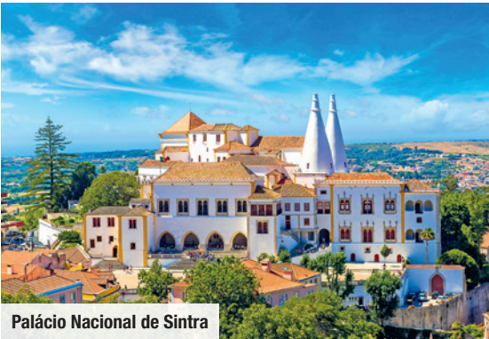
Palácio Nacional de Sintra