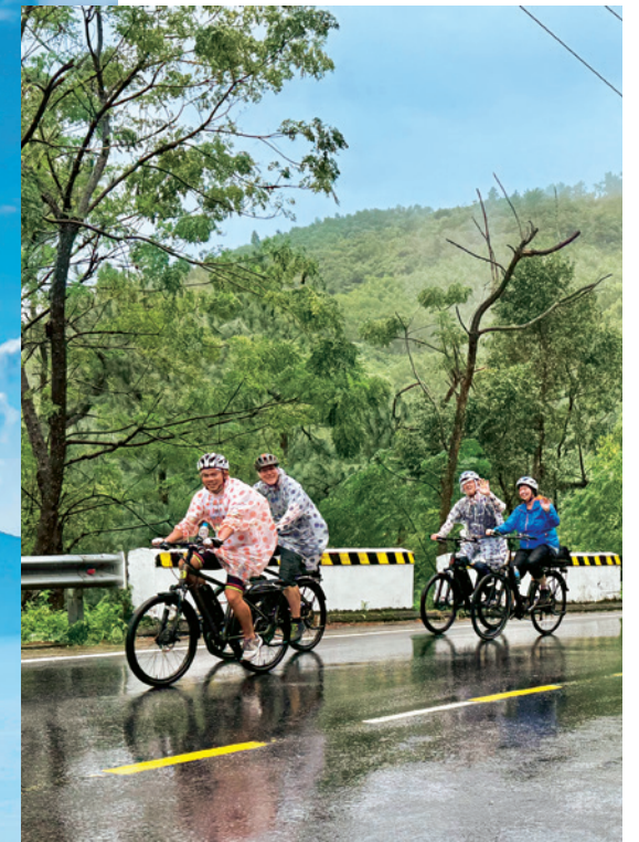
Ungewollte Dusche Trotz Dauerregen ist die E-Bike-Reisegruppe gut gelaunt unterwegs

Strand im Blick Bei gutem Wetter sieht man vom Wolkenpass aus das Südchinesische Meer