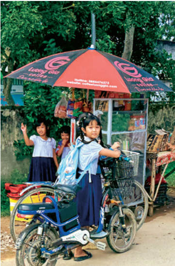
Publikum am Straßenrand Schülerinnen im Ort Thanh Son, knapp 120 Kilometer entfernt von Ho-Chi-Minh-Stadt