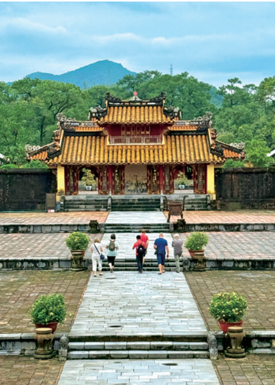
Heilige Hallen Am dritten Tag besucht die Gruppe das Grab von Kaiser Minh Mang südwestlich von Hue

Entdeckungsreise durch Zentral- und Südvietnam