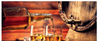
Besuch einer Whiskey-Brennerei

Bei Vorabbuchung sparen Sie € 10 p. P. € 169 p. P.