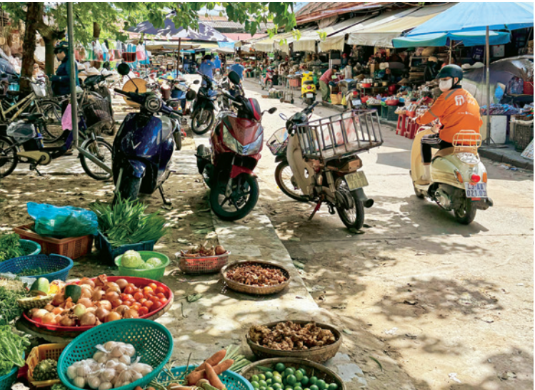
Obst, Gemüse, Gewürze Der Markt von Hoi An liegt am Ende der Altstadt. Verkauft wird draußen sowie in einer überdachten Markthalle

von der Brille, zieht die Kapuze seines gepunkteten Plastikponchos zurecht und tritt in die Pedale. Das Tagesziel, die 350.000-Einwohner-Stadt Hue, ist noch drei Fahrstunden entfernt. Immerhin geht es ab jetzt auf einer breiten Teerstraße bergab. Der Regen wird weniger, der Nebel lichtet sich allmählich.