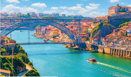
Bootsfahrt auf dem Douro

trendtours Touristik GmbH, Düsseldorf Straße 9, 65760 Eschborn · Änderungen – auch im Ablauf der Reise – und Druckfehler vorbehalten.