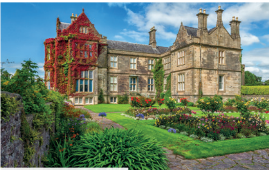
Gärten von Muckross House

✓ 9-tägige Flugreise mit Bus-Rundreise durch Irland