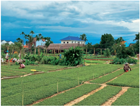
Selbstversorger Viele Vietnamesen haben eine Gartenparzelle wie hier in Cam Ha, einem ländlichen Stadtteil von Hoi An