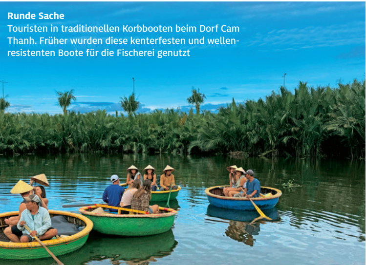
Runde Sache Touristen in traditionellen Korbbooten beim Dorf Cam Thanh. Früher wurden diese kenterfesten und wellen-resistenten Boote für die Fischerei genutzt