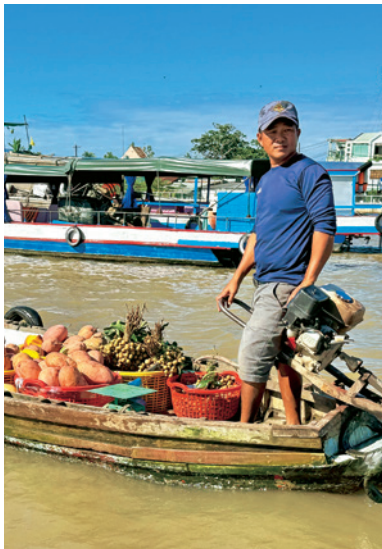
Schaukelnde Früchte Auf einem Mekong-Nebenarm gibt es in Can Tho den schwimmenden Obstmarkt

Das 450 PS starke Schiff Mekong Eyes besitzt 14 Kabinen auf 39 Metern Länge